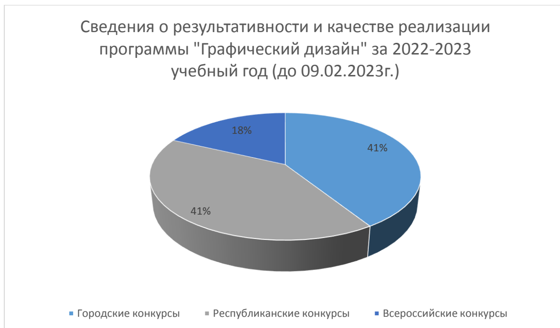
Рис.1. Сведения о результативности и качестве реализации программы «Графический дизайн» за 2022-2023 учебный год (до 09.02.2023г.)

9.02. Городская научно-практическая конференция педагогических работников образовательных организаций (участие).