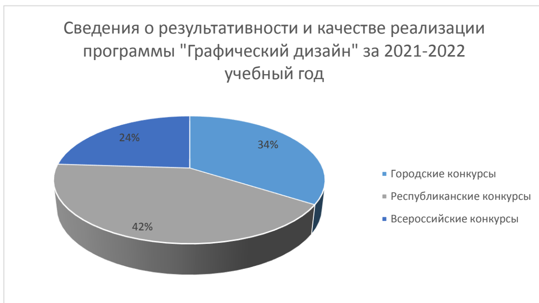
Рис.1. Сведения о результативности и качестве реализации программы «Графический дизайн» за 2021-2022 учебный год

9 – 11.06. Очный этап V Всероссийского конкурса «Идеи, преображающие города» г. Москва (участие).