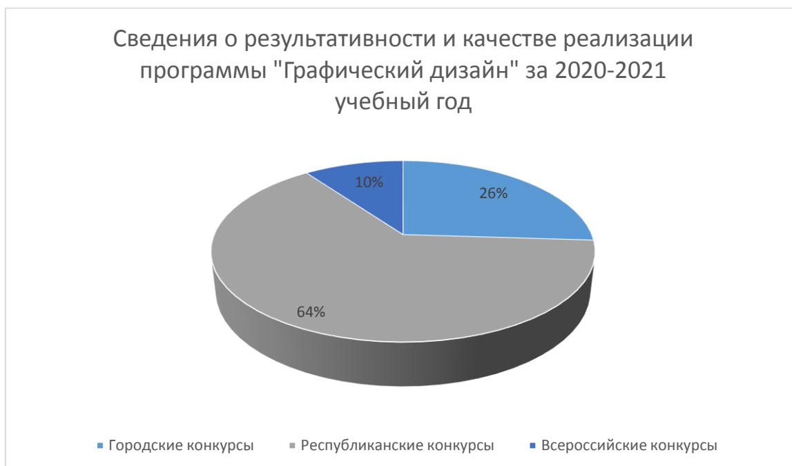
Рис.1. Сведения о результативности и качестве реализации программы «Графический дизайн» за 2020-2021 учебный год

29.04. Городской слет одаренных детей «Созвездие талантов» (участие).